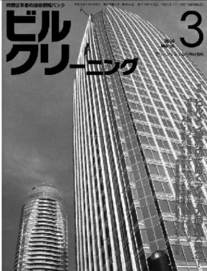
▲ 作業従事者の技術情報バンク「ビルクリーニング」 2009年3月号掲載