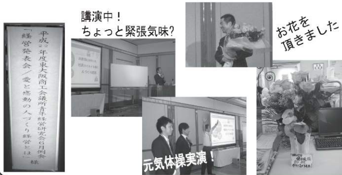
講演中！ ちょっと緊張気味？

東大阪青年経営研究会6月例会 社長が「経営発表会/愛と感動の人づくり経営とは」という題目で講演をされました。