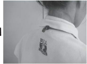
後ろからもスッキリ