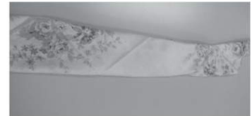
薄手のタオルに巻く