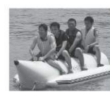
ベル男組いざ出陣