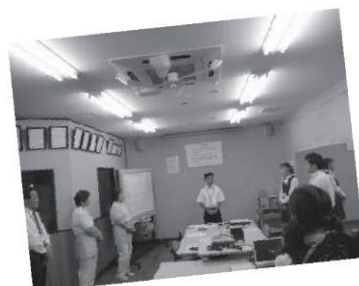
新人研修全体朝礼風景です☆