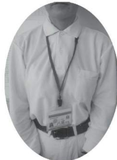
前からもスッキリ