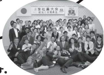
写真は2009年全社員大会の様子です。

私達が何より嬉しいこと... それは日頃お会いできないあなたと会って、同じ時を過ごし、 一緒に笑って、一緒に泣いて、感動する時間を共有できること... 今年もまた一緒に素敵な思い出を増やしましょう!!! 本社スタッフ一同