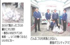
30分でもまったゴミの量は2倍 一番多いのはトイレの掃除、いつか集くるといいのにな〜 どんなゴミも片付かせない、 最後ボランティアマン

今月2回目のボランティア清掃。 毎回たくさんの方が参加してくれるので、たくさんゴミを重めることが出来、結果、会社周辺の道路がいつも綺麗に保たれています。 ありがとうございました。 早稲でも少しは明るくなって、気温も暖かくなってきてるのでボランティアには最高の季節がやって参りました。 ますます張り切って頑張らしましょう!