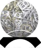
明星シンセティック株式会社より ご協力頂きました。