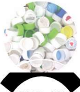
住電資材加工株式会社より ご協力頂きました。