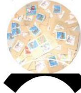
FMエージェンシー株式会社より ご協力いただきました

※お願い：いつも社会貢献活動にご協力頂きありがとうございます。 せっかく集めて頂いたのでちゃんと活躍してもらいたいと思います。 お手間をお掛けしますがご協力をお願い致します。 お願い①使用済み切手を封筒から切り離す際、切手の周りのギザギザ部分を切り落とさず、周り5ミリ程度残して下さい。 お願い②ボトルキャップは洗って衛生的な状態で送って下さい。