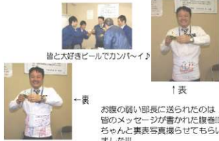
誰と大好きビールでカンパ〜♪

1月31日に誕生日を迎えた中明部長♪ 1月の社内報には当然間に合うこともなく、1人だけ今月の掲載となりました。 1月誕生日の順を踏めくつくれる部長。 40歳を迎える今回の誕生日は厄年突入と言うこともあり特別な誕生日になったのではないのでしょうか???