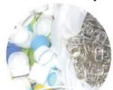
株式会社SOTEN INTERNATIONAL様より ご協力頂きました。

※お願い：いつも社会貢献活動にご協力頂きありがとうございます。 せっかく集めて頂いたのでちゃんと活躍してもらいたいと思います。 お手間をお掛けしますがご協力をお願い致します。 お願い①使用済み切手を封筒から切り離す際、切手の周りのギザギザ部分を切り落とさず、周り5ミリ程度残して下さい。 お願い②ペットボトルキャップは洗って衛生的な状態で送って下さい。