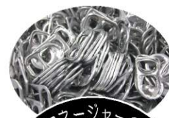
高岡マナージャーの友誼