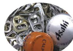
明星シンセティック(株)様

※お願い：お願い①使用済み切手を封筒から切り離す際、切手の周りのギザギザ部分を切り落とさず、周り5ミリ程度残して下さい。