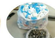
中井商工株式会社様