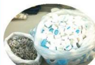
株式会社コボリ様