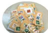
株式会社コボリ様