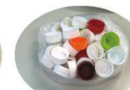
松山さんのお母様