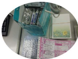
テラ・ルネッサンスへ…