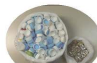
株式会社コポリ様