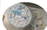
株式会社 SO-TEN INTERNATIONAL 様