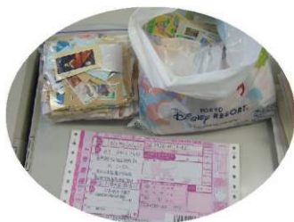
日本盲導犬協会へ…

ジャパンハート ( http://www.japanheart.org/ ) テラ・ルネッサンス ( http://www.terra-r.jp/ ) 日本赤十字社 ( http://www.jrc.or.jp/ ) 日本盲導犬協会 ( http://www.moudouken.net/ ) 会員登録による支援 (年会費制)