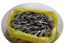
明星シンセテック様