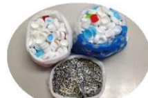
株式会社コポリ様