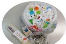
SO-TEN INTERNATIONAL 株式会社様