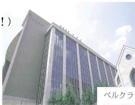
ベルクラシック大阪