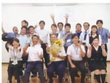
皆で記念撮影☆ 中明部長が東京出張で 居なくて残念>>