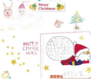
お礼書き 中野 大矢