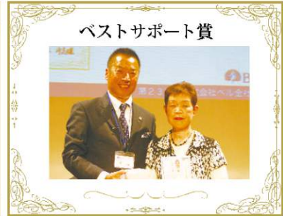
ベストサポート賞