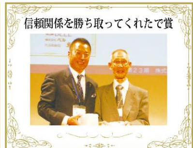
信頼関係を勝ち取ってくれたで賞