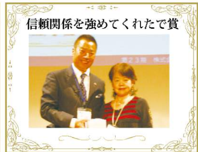
信頼関係を強めてくれたで賞