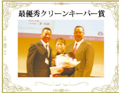
最優秀クリーンキーパー賞