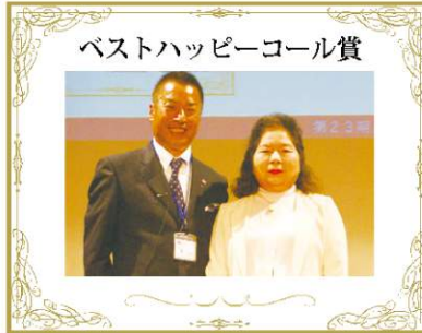
ベストハッピーコール賞