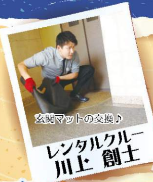
玄関マットの交換♪