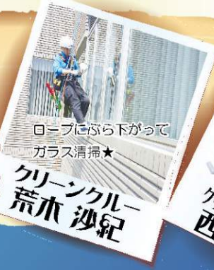
ロープにぶら下がり ガラス清掃★