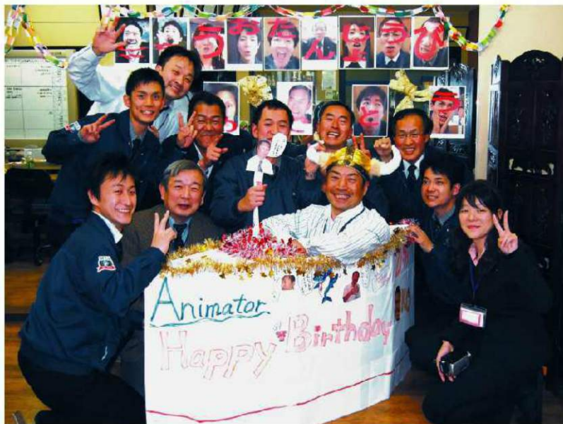
2009年 1月19日、本社にて社長誕生日 船好きの社長のため、本社スタッフがこっそり船を作り「サプライズ誕生日会」を行いました ちなみに49歳になりました