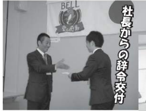
社長からの辞令交付