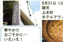
8月31日(日) 晴天 上本町 ホテルアウイーナ大阪 華やかに おそそに… いえいえ！ すこぶる楽しく開催